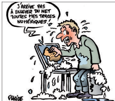
Un dessin extrait du document « Merveilleux et impitoyable Internet ».